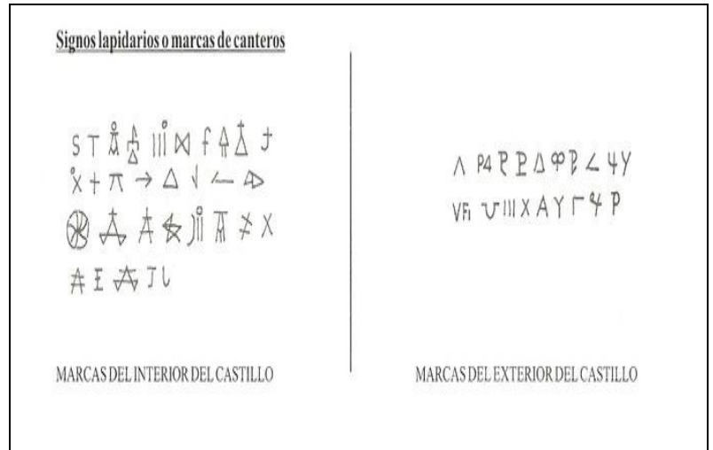
Marcas de cantero del castillo