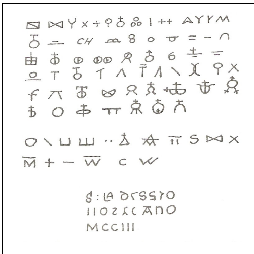
Marcas de cantero de la iglesia de Acebo