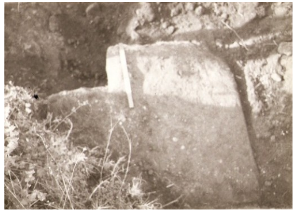
Diversas instantáneas de la puerta NW de la muralla de Cáparra en dirección a Mérida