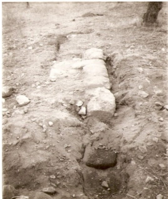
Restos de la muralla y posible puerta Sur del Cardo principal