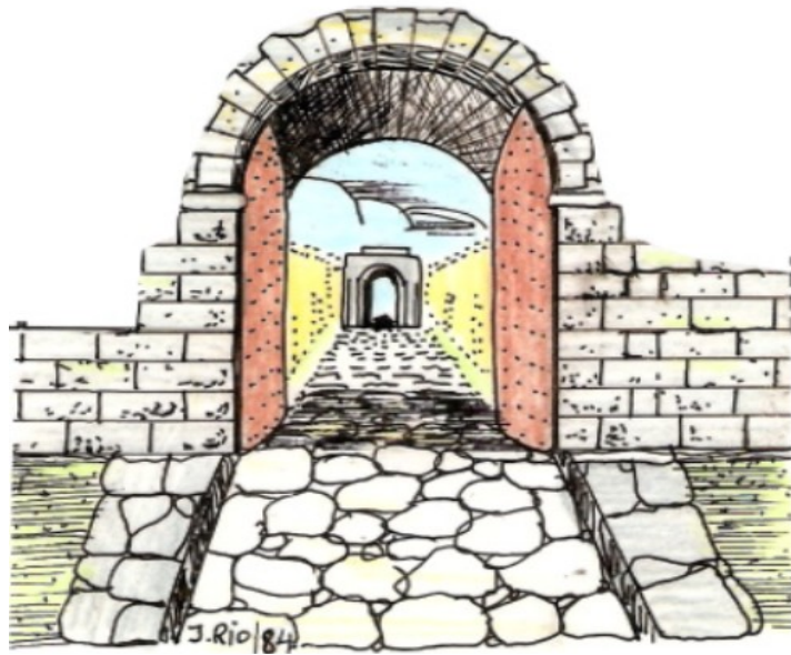
Dibujo hipotéticos de la puerta