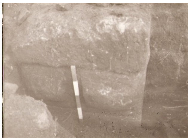
Esquina almohadillada y el encaje de la hoja de la puerta